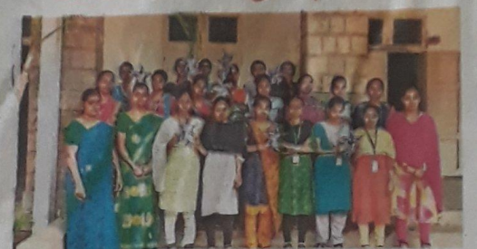
🛮 ஜி.வி.ஜி., விசாலாட்சி மகளிர் கல்லூரி.